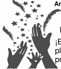
Grupo de padres • Parent Group